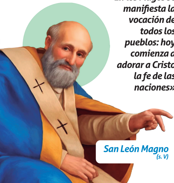
San León Magno (s. V)

«En los Magos se manifiesta la vocación de todos los pueblos: hoy comienza a adorar a Cristo la fe de las naciones»